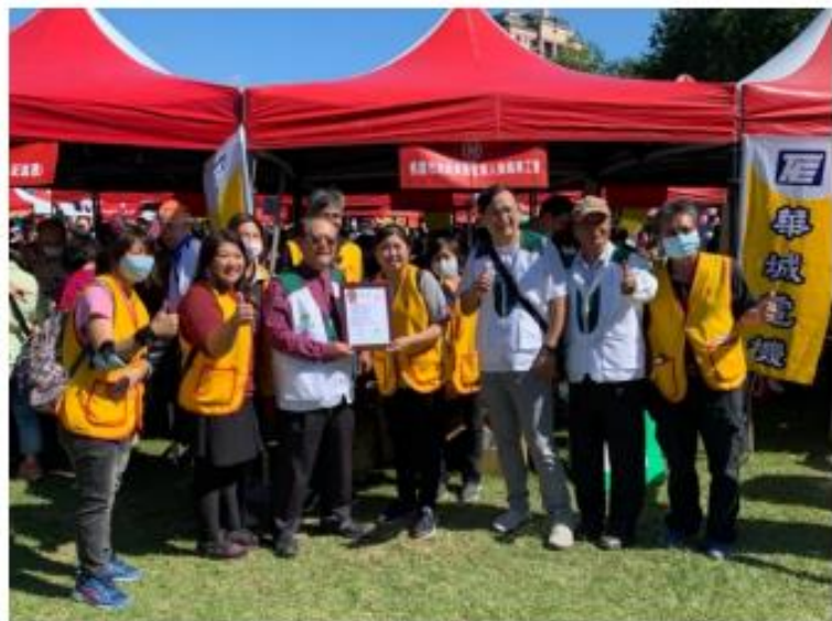
社姿誼委員及辛苦的志工代表接受感謝狀

今年許憲樑社福基金會捐助3萬元活動經費，華城電機除了捐助2萬元活動經費還另外贊助了12個50周年背包，為這次的愛心添磚加瓦。