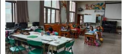
財團法人台灣基督長老教會彰化中會 仁愛教會