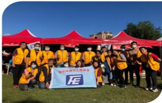
感恩志工們熱情參與，使活動圓滿成功