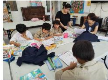
財團法人台灣基督長老教會彰化中會 路上教會